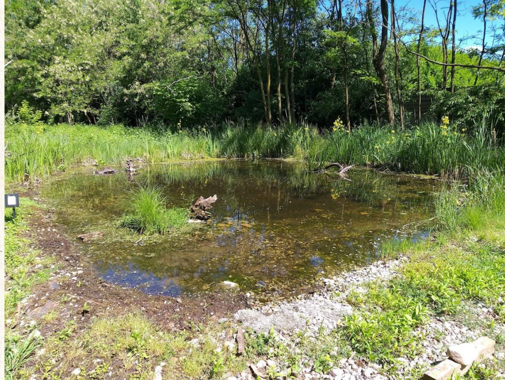
Oasi Cinin (Parabiago)