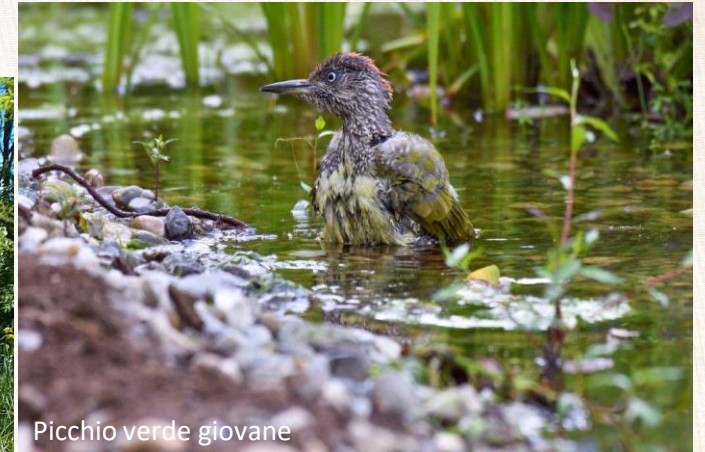
Picchio verde giovane