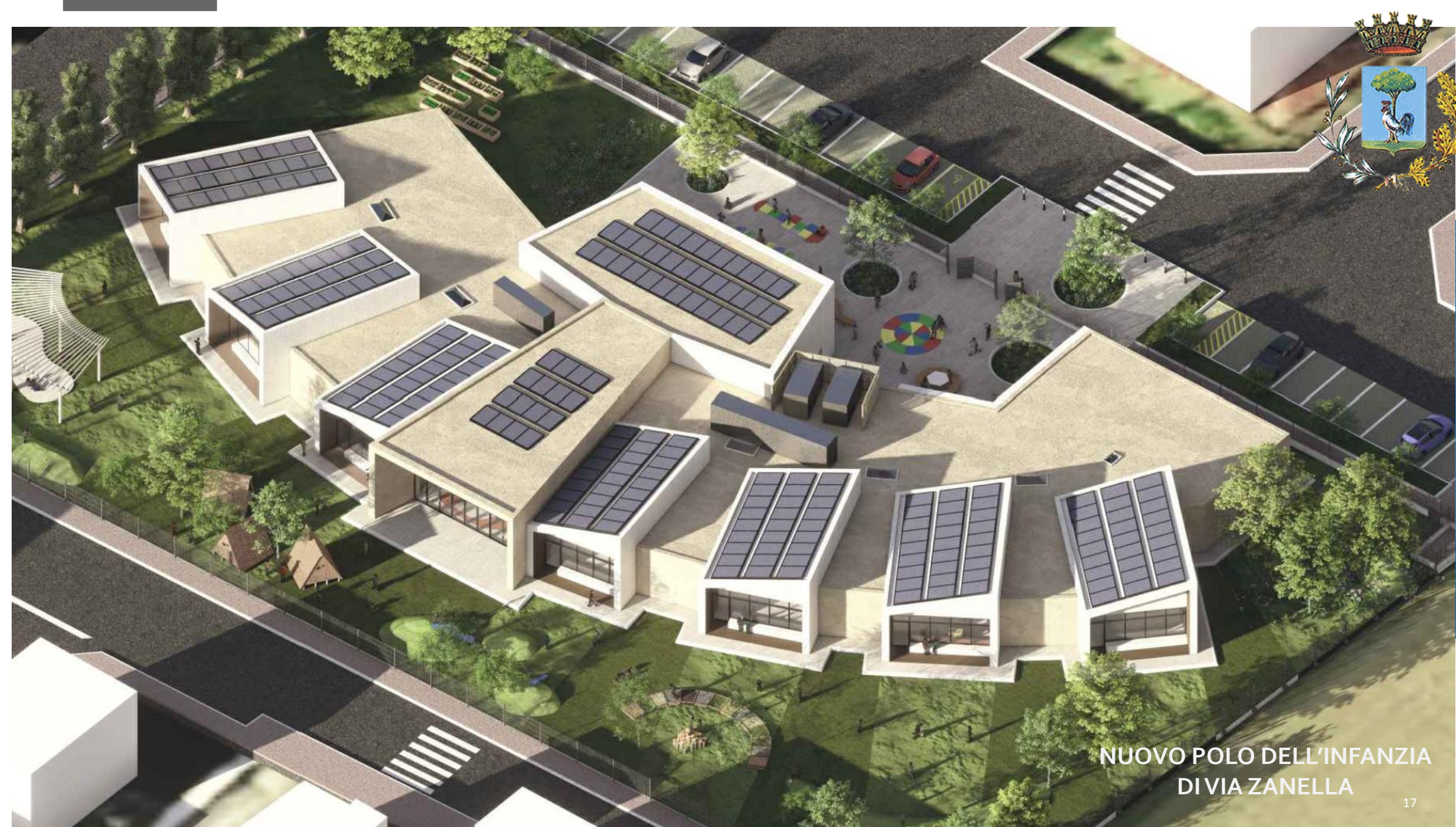
NUOVO POLO DELL'INFANZIA DIVIA ZANELLA